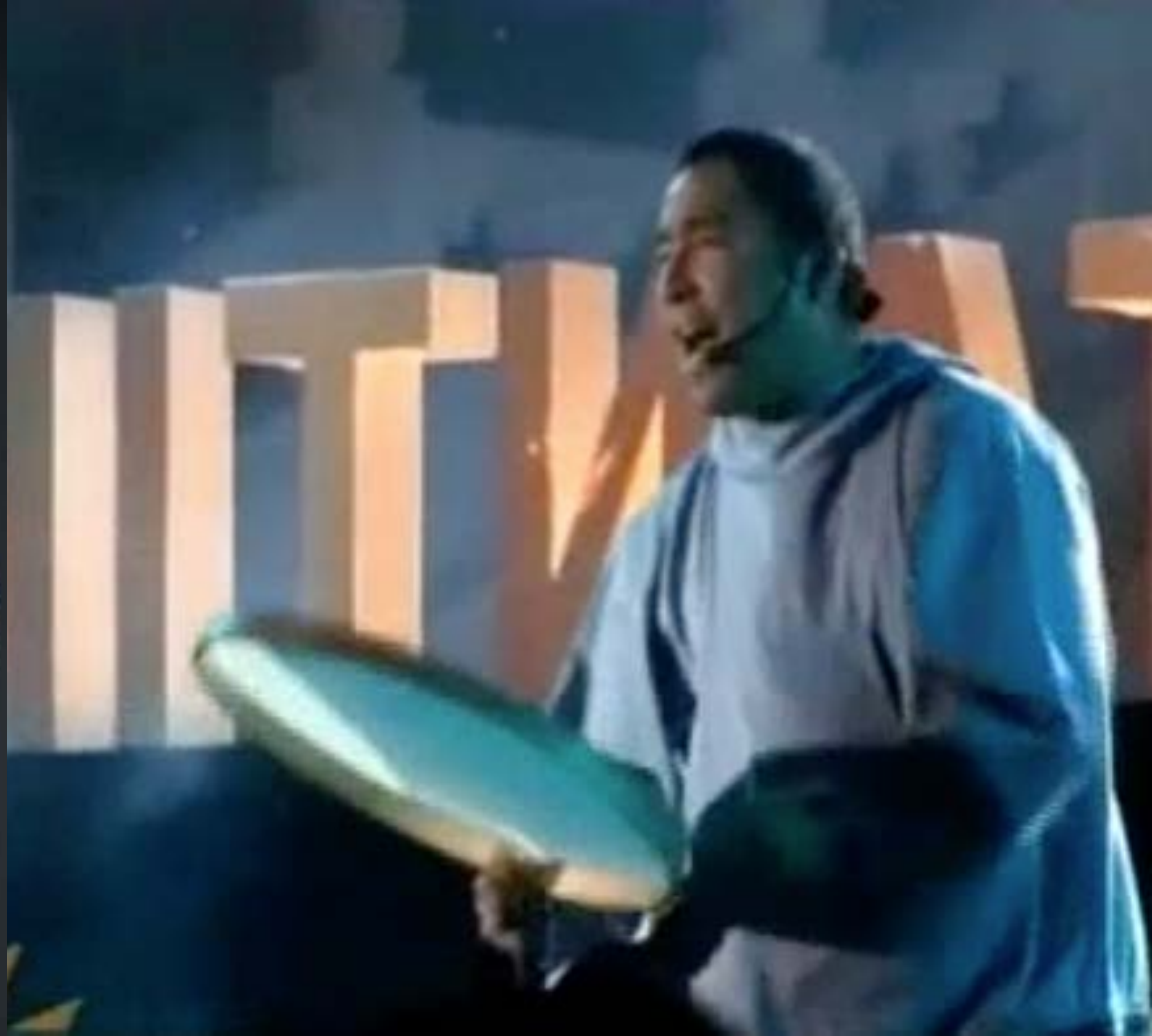
Vacheron Constantin江詩丹頓 250週年 Mask面具系列活動 台北故宮 2007