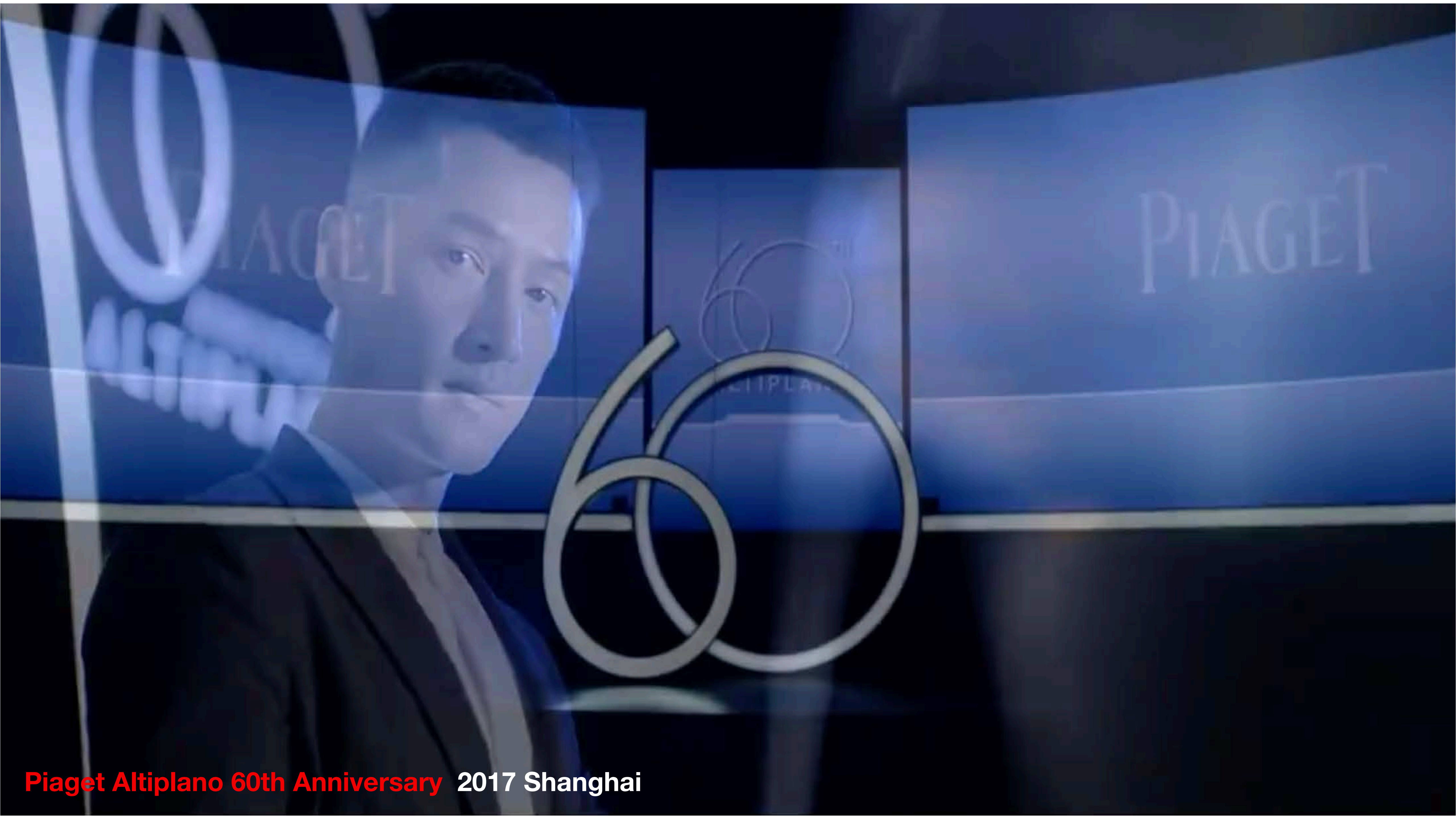
Piaget Altiplano 60th Anniversary 2017 Shanghai