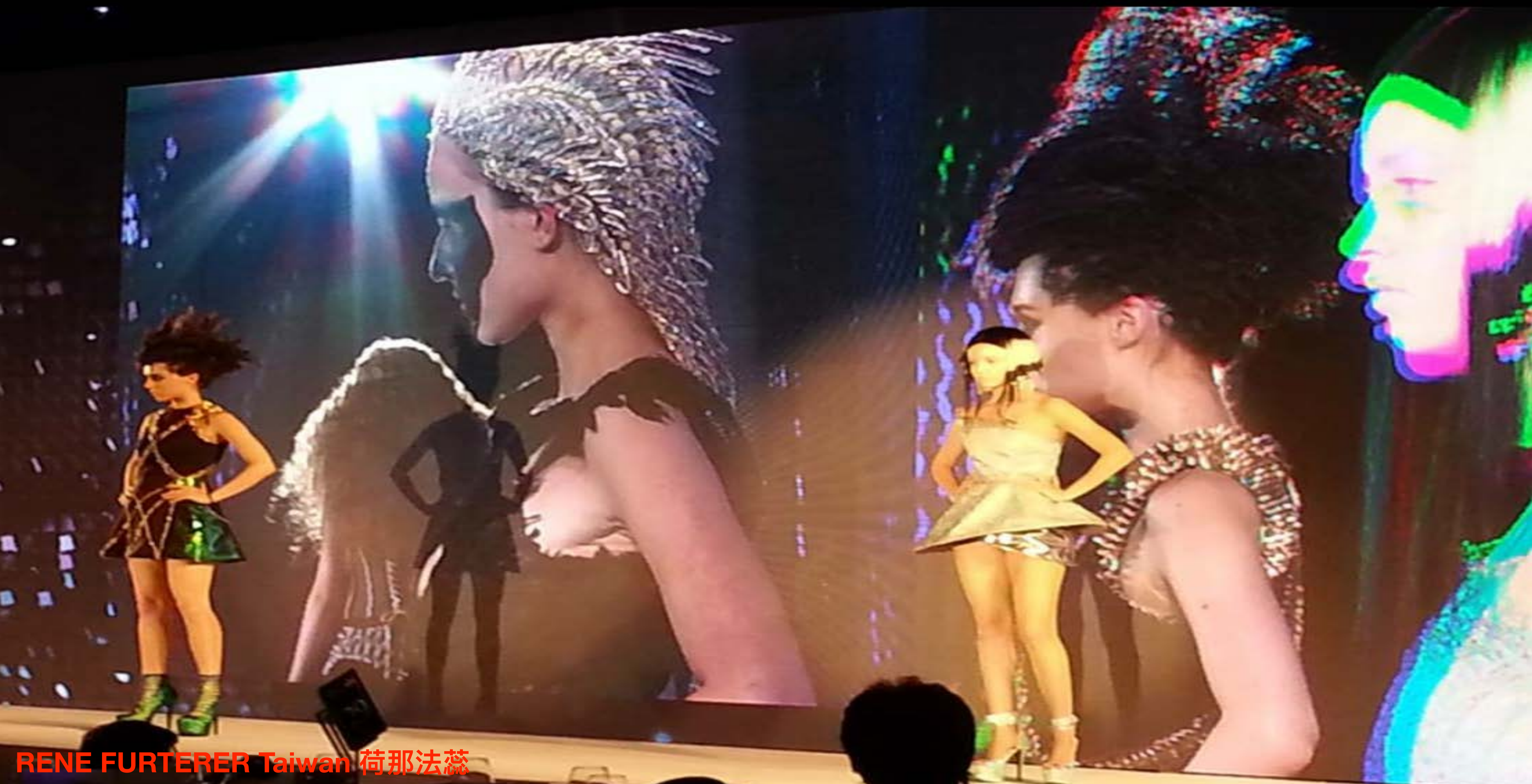
RENE FURTERER Taiwan 荷那法蕊 2015 Midsummer Night Gala Hotel Taipei