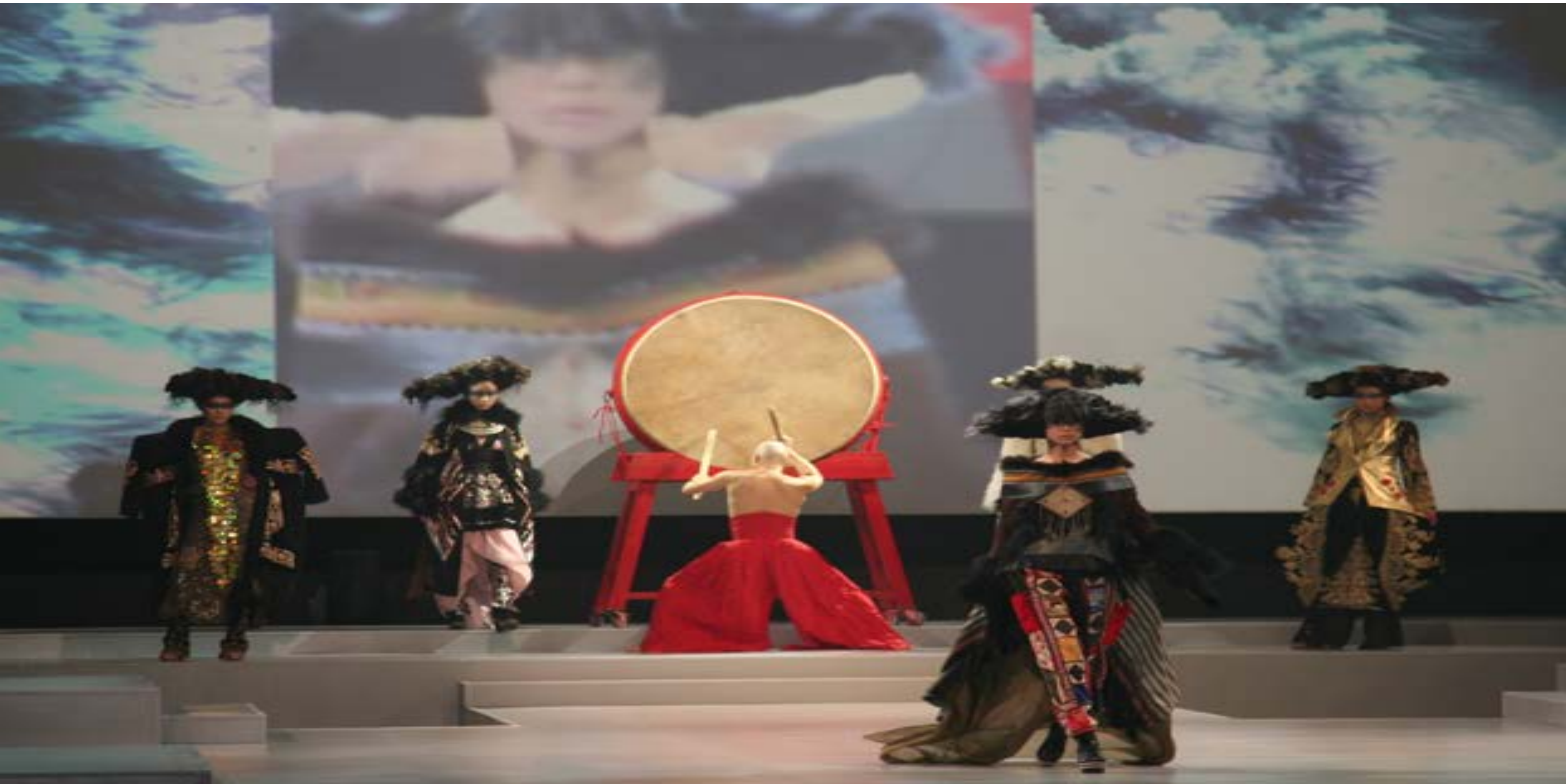
L'Oréal Professionnel 100週年系列活動 CHINA IN PARIS 巴黎羅浮宮 2009 PARIS IN CHINA 北京 2011 8